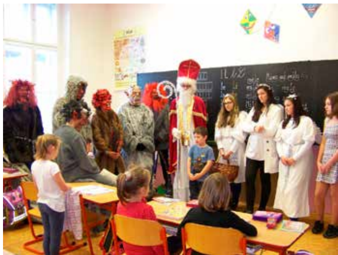
Čertovská družina na 1. stupni