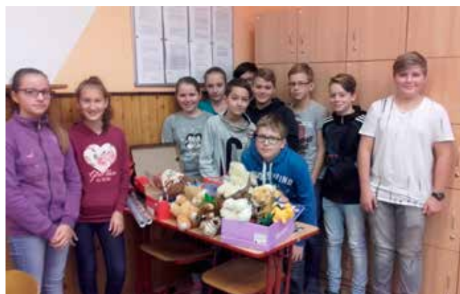
Někteří žáci ze 7. A se zapojili do akce s názvem Krabice o bot. Přinesli do školy bloky, hračky, psací potřeby atd. a naplnili tak těmito věcmi tři krabice od bot, které udělají radost třem dětem z chudších rodin v okolí. Více info na www.krabiceodbot.cz .