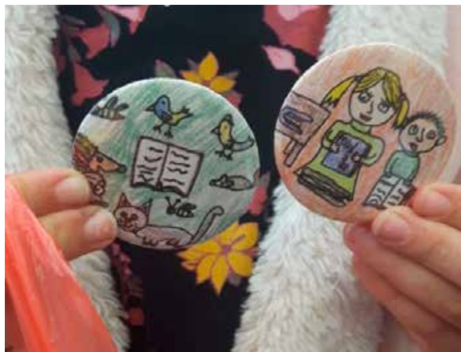
Školní družina se zapojila do soutěže na téma Nejkrásnější knihovnický button