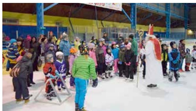
Mikuláš na ledě – akce 9. B