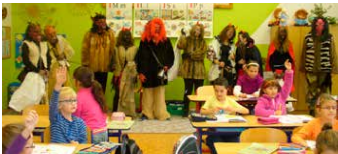
Mikulášská družina na I. stupni