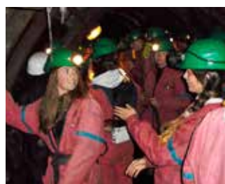
Exkurze v grafitovém dole