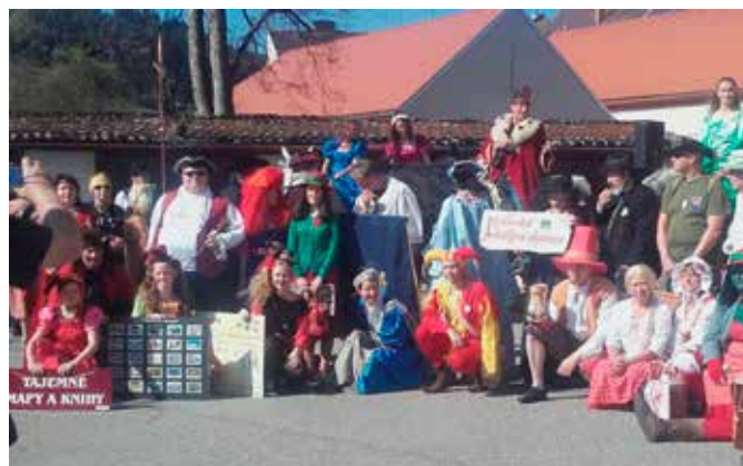
Pohádkový den ve Vimperku za účasti ZŠ TGM a herce Václava Vydry