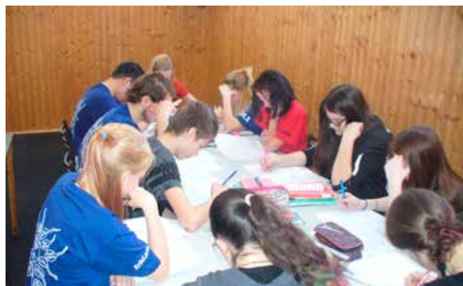
Zvládnou to - příprava na přijímací zkoušky