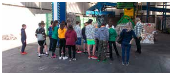
Den Země – návštěva Jihoseparu, 7. A