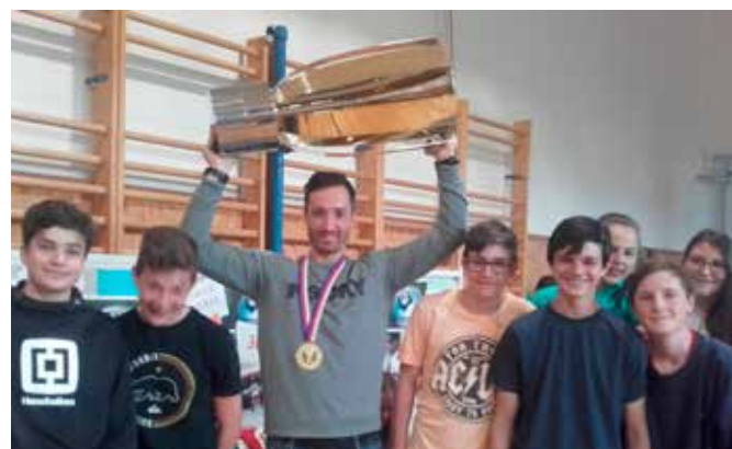
Na besedu do ZŠ TGM Vimperk zavítal Šimon Hrubec – vítěz extraligy v ledním hokeji 2018/19, brankář hokejového reprezentačního týmu, vimperský rodák a bývalý žák naší školy.