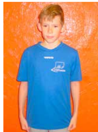
Žáci 1. stupně budou mít nová sportovní trička