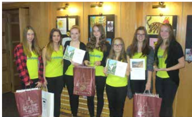
Příjemné prožití vánočních svátků a jen to nejlepší v roce 2018 přejí mažoretky Klapeto Vimperk - Talent okresu Prachatice 2017