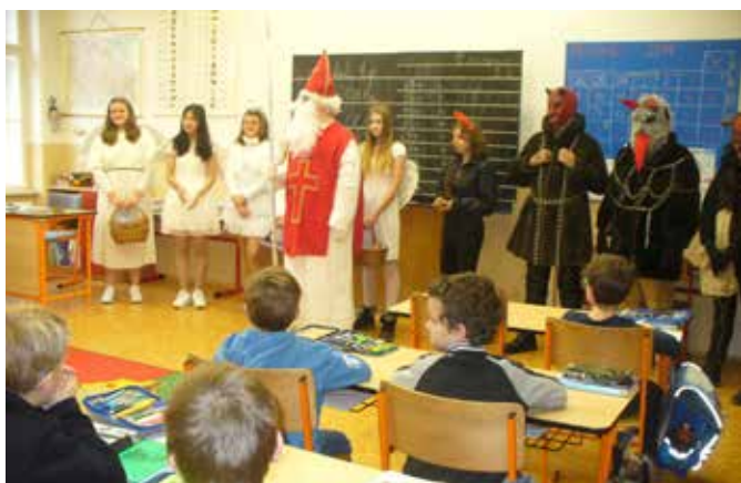
Mikulášská návštěva tvořená žáky 4. tříd na 1. stupni.