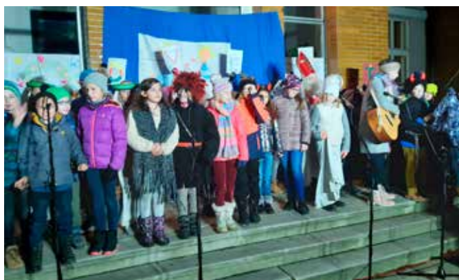
Slavnostní rozsvícení vánočního stromu u školy