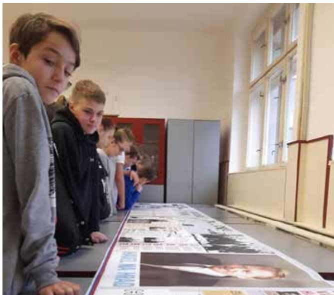
Z besedy k 30. výročí „Sametové“ revoluce